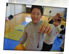
*みんなで協力できたよ。