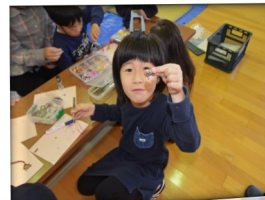
*かわいいのができたね。