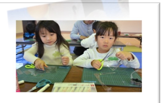
*自分でがんばったよ。

・11/16（土）の『土曜ひろば』で、プラバンを使ってクリスマスイメージした作品を作りました！クリスマスだけにこだわらずに自分が好きなキャラクターや好きな絵などをイメージして作ったことで、一人ひとりの個性あふれた作品が出来ました。作成中は、『道具や備品をゆずりあったり、難しい作業も自分で頑張ってみようという姿があり』、とても楽しい時間となりました。また、作ったキーホルダーなどを、お手伝いしていただいた先生にプレゼントをしたり、出来上がった作品を保護者の方に喜んで見せている姿が本当によかったと思います。縦のつながりや、コミュニケーションの活性化にもつなげることが出来たと思います。