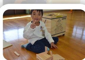
*先生お手伝いありがとう。