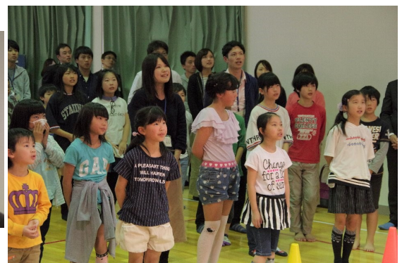
橋岡の歌をみんなで歌いました