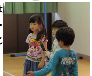
はじめての自主活です

小学校の自主活動学級では、部落問題学習をはじめ、あらゆる差別を許さない人権学習・教科学習・共同制作・自主活交流会など、様々な活動を通じて、人とのふれあいやつながりを大切にしながら、「差別を見抜き、差別に共に怒りをもてる子ども」、「お互いに支え合える仲間づくり」をめざしています。