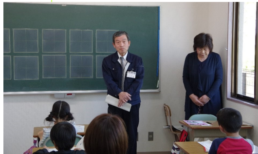
↑字の書き方をしっかり聞きましょうね！