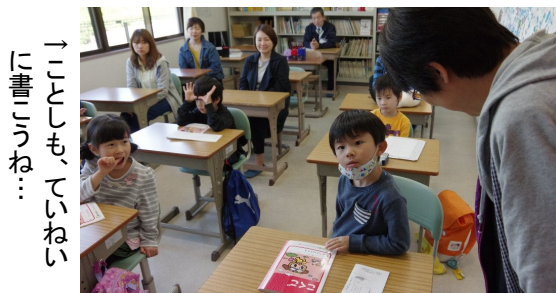
→ことしも、ていねいに書こうね…