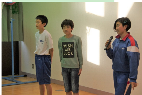
中学生がきてくれました

保護者の方々、地域の方々、いつでも自主活動学級を参観、参加していただき、子どもたちに励ましの言葉をかけながら、差別を見抜き許さない仲間づくりができるよう、サポートしてください。