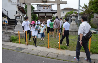
レクリエーションと交流の時間。