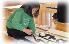
姿勢も気を付けながら丁寧に出来ました。