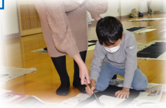
初めての書初めで、少し緊張しましたが、一生懸命頑張りました。