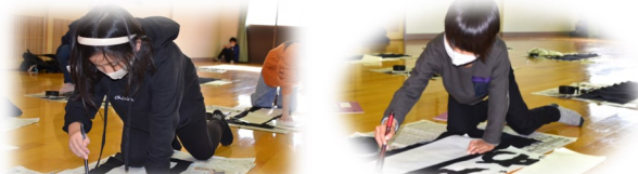
体全体を使って力強く丁寧に書いていました。