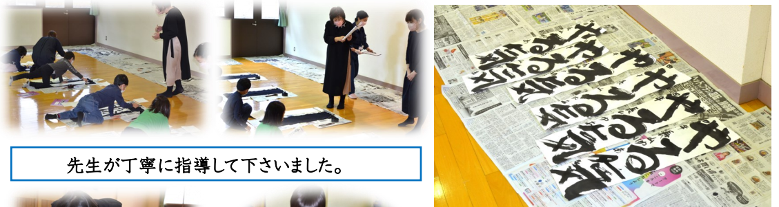
先生が丁寧に指導して下さいました。