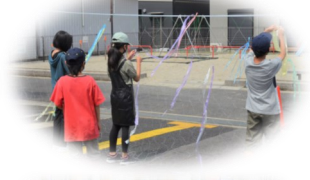
6年生最後の夏期集中学習会、最高の笑顔でしたね！