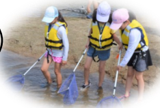
いつも感謝の気持ちを！